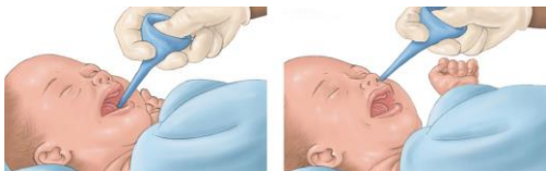
Sogað úr munni