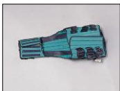
Stutt bakbretti KED vesti