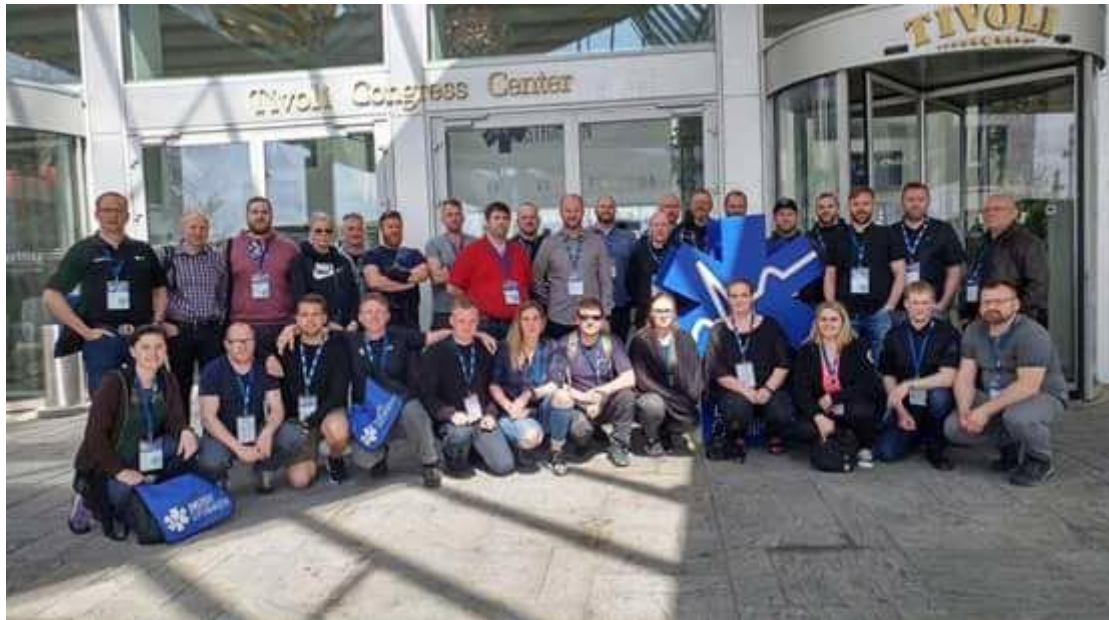
Hópur íslenskra sjúkraflutningamanna á ráðstefnunni EMS 2017 í Kaupmannahöfn.