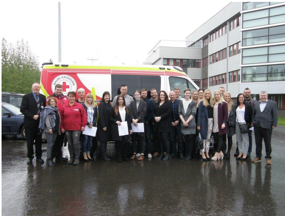
Hluti útskriftarnema 2017 ásamt fomannti Fagráðs skólans og skólastjóra.

Á árinu 2017 voru haldin 64 námskeið (voru 30 árið 2016) og var heildarfjöldi þátttakenda 725 (voru 282 árið 2016). Ljóst er að umfang skólans hefur vaxið mikið milli ára.