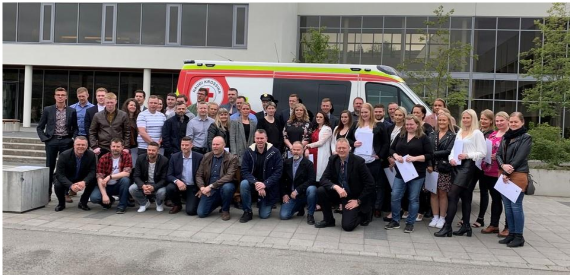
Frá útskrift Sjúkraflutningaskólans 1. júní 2019

Á árinu 2019 voru haldin 62 námskeið (voru 47 árið 2018) og var heildarfjöldi þátttakenda 567 (voru 478 árið 2018). Fjöldi námskeiða og nema í sjúkraflutningum, og í vettvangshjálpi er nokkuð stöðugur milli 2018-2019 en nokkur aukning varð í endurmenntunar- og sérnámskeiðum milli 2018 og 2019.