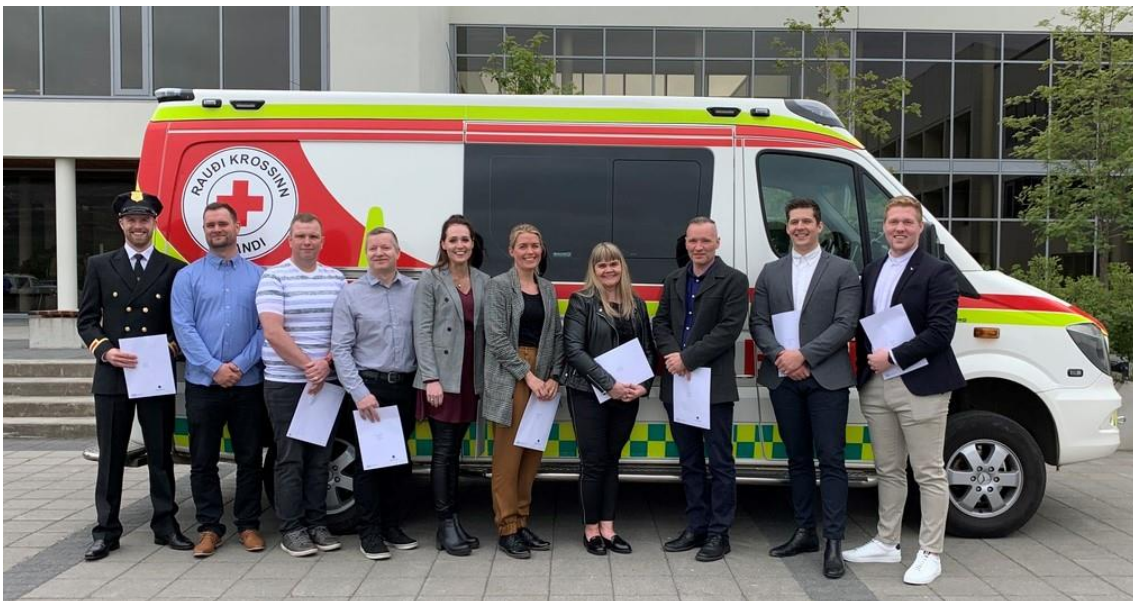
Hluti EMT-Advanced útskriftarnemar Sjúkraflutningaskólans.